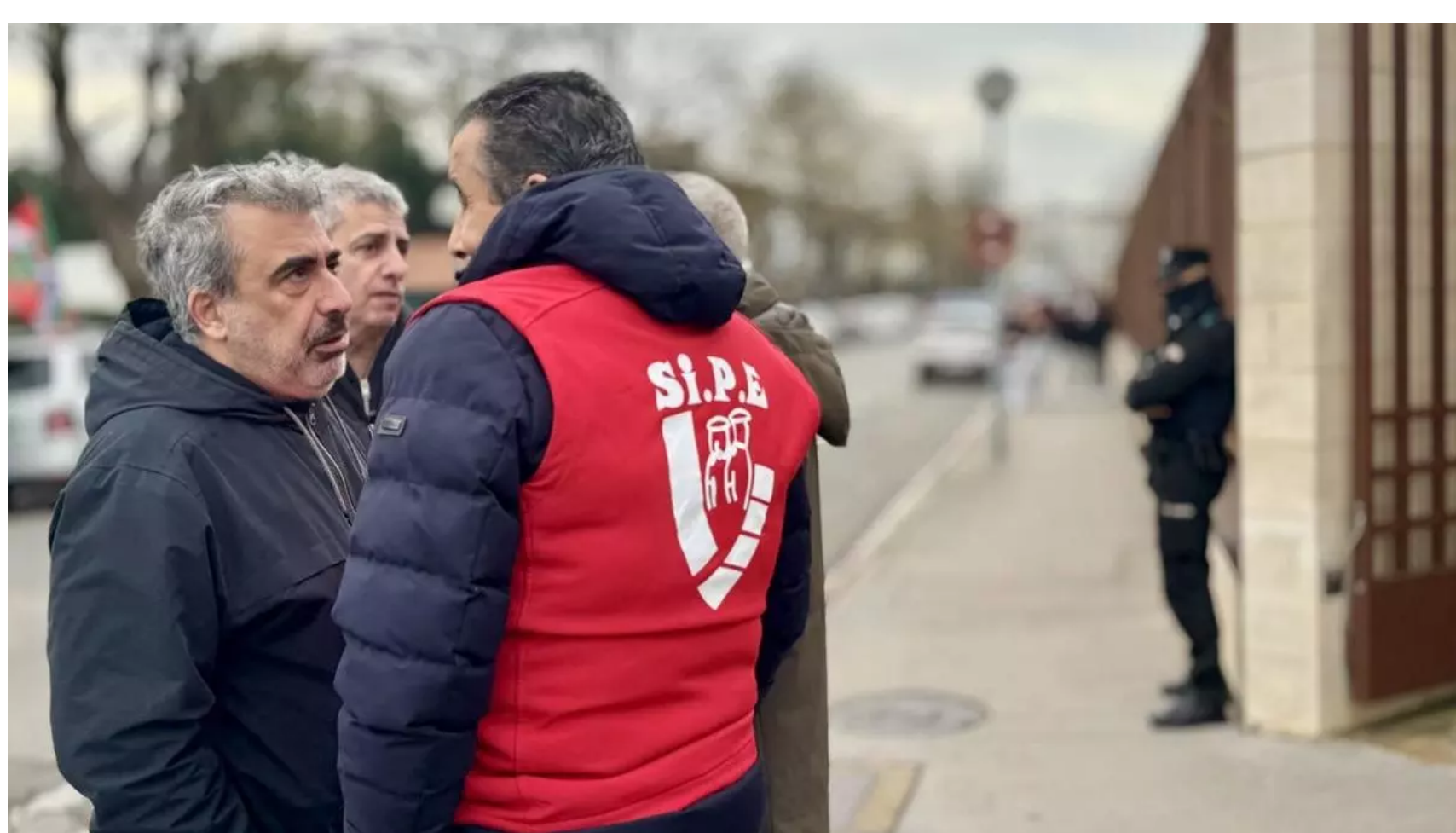
Representantes de los sindicatos de la Ertzaintza, este martes frente a la Presidencia vasca